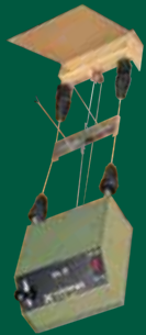
Scheibenzuganlage 10 m EL 3