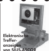
Elektronische Treffer- anzeigen von SIUS-ASCOR

Ein Begriff für perfekte Schießstand- technik