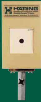
Elektronische Scheibenanlage 10 m ESA 10

Elektronische Scheiben Typ ESA für alle Distanzen! Zuganlagen für alle Sportdisziplinen! Fordern Sie kostenfrei unser Prospektmaterial an.