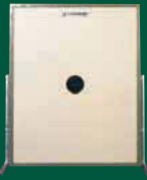
Elektronische Scheibenanlage 300 m ESA 300