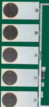
Duellanlage 25 m PA 25