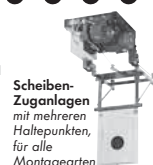
Scheibenzuganlagen mit mehreren Haltepunkten, für alle Montagearten

Postfach 1140 · D-35086 Battenberg Tel. (0 64 52) 93 32-0 · Fax: (0 64 52) 93 32-163 E-mail: info@johannsen.de Internet: www.johannsen.de