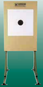
Elektronische Scheibenanlage 25/50/100 m ESA 25 ESA 50 und ESA 100