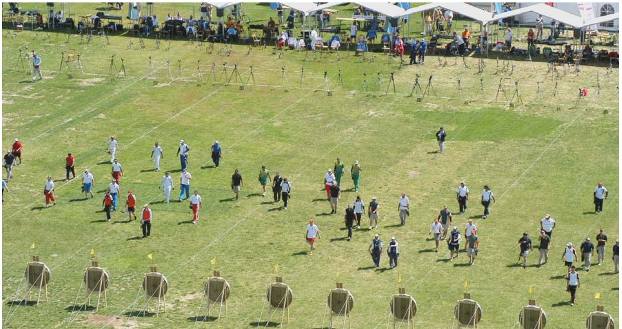
Bild Nr. 1.2.1 Offener Bogenplatz

Liegen mehrere Wettkampfbahnen nebeneinander, haben die seitlichen Abstände und die der Scheiben voneinander mindestens 2 m zu betragen.