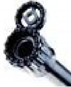
Zielvorrichtungen jeglicher Art