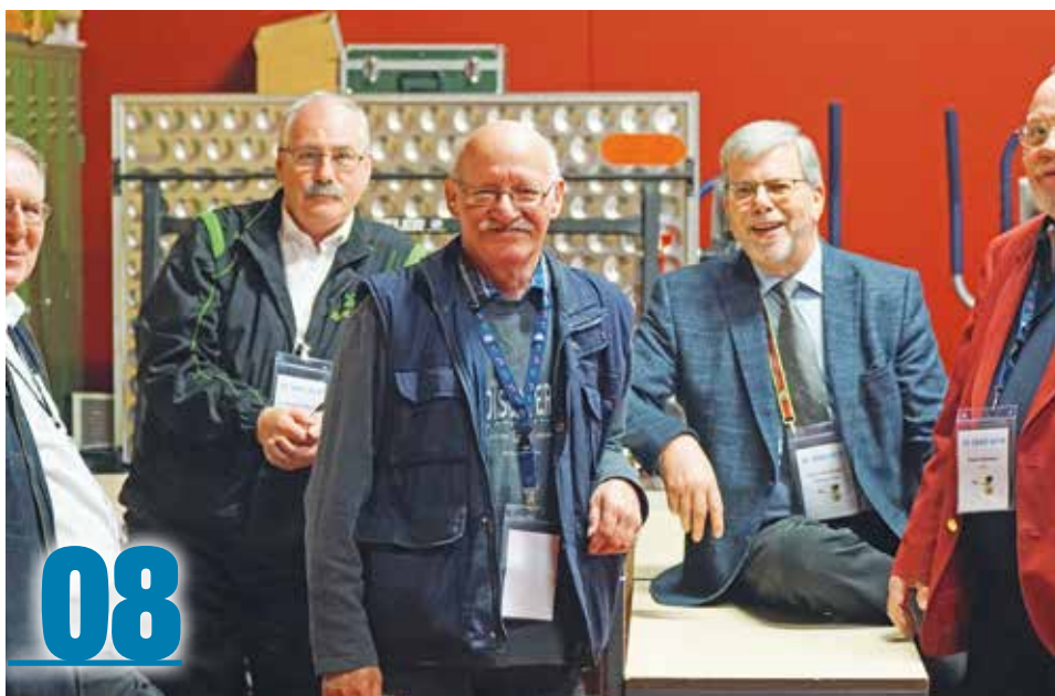
Die sympathischen Wettkampfhelfer beim 35. ISAS