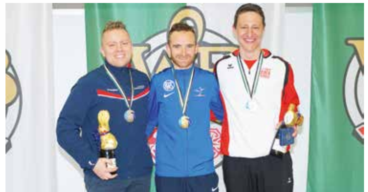
Frankreich vor Norwegen und der Schweiz im Dreistellungskampf