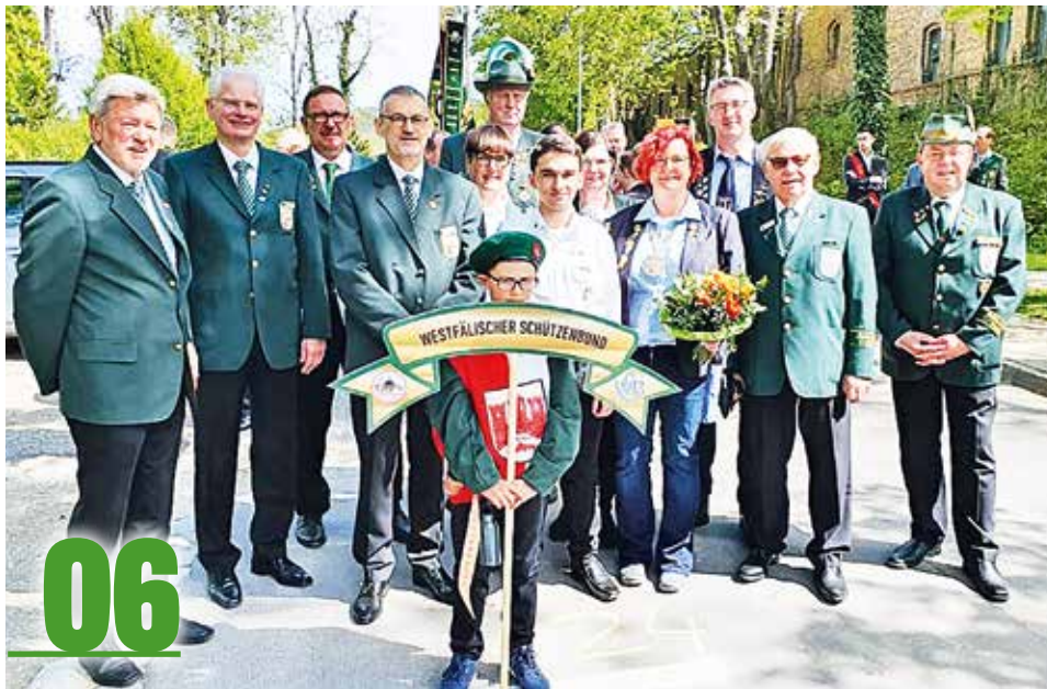
Die westfälische Delegation beim Festzug in Wernigerode

Spannende Wettbewerbe des 35. ISAS im LLZ Dortmund 8 - 12 35. ISAS Ergebnisse 12 Gelungener Pre-ISAS als Vorwettkampf zum 35. ISAS 2019 in Dortmund 12 Weltcup Acapulco: Felix Haase ganz starker Sechster 13 Die SG Bad Salzuflen gewinnt den Endkampf der Verbandsliga Bogen 13 Heike Frey löst Denise Palberg an der Spitze der RWK 3x20 ab 14 „Längstes Verbandsligafinale aller Zeiten“ der Luftgewehrsportler 2019 14 Die WSB Verbands- und Westfalenligen für die Saison 19/20 stehen fest 14