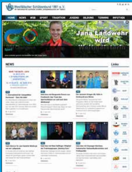
WEBSITE WSB 1861