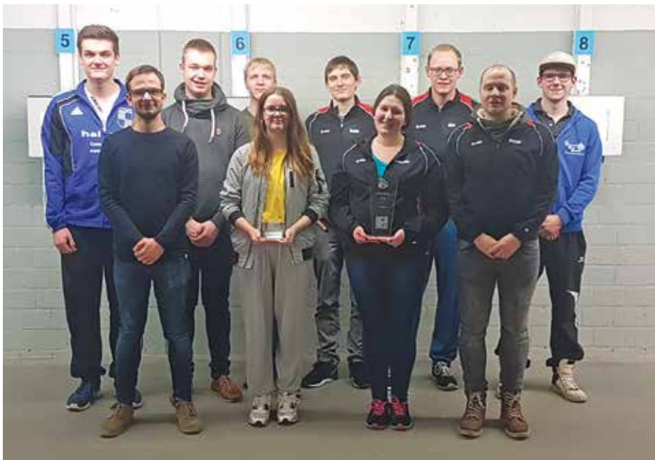
Andreas Hofer Gladbeck steigt in die Westfalenliga auf