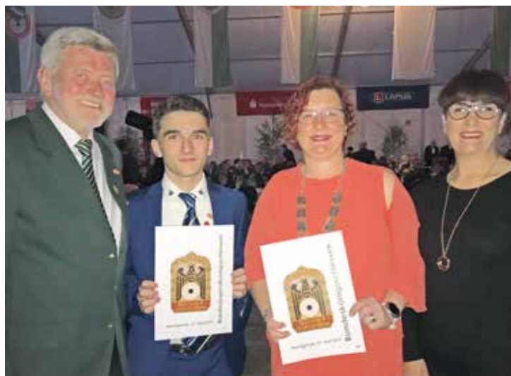
Glückwünsche an den Landesjugendkönig und die Landeskönigin des WSB

und 2017 heizungs- und gebäudetechnisch umfassend saniert. Damit bleibt die größte überachte Schießsportanlage Deutschlands auch zukünftig die erste Adresse für nationale und internationale schießsportliche Großveranstaltungen. In seine Amtszeit als Präsident fallen auch zahlreiche sportliche Erfolge westfälischer Schützinnen und Schützen bei Europa- und Weltmeisterschaften, Weltcups und Olympischen Spielen.