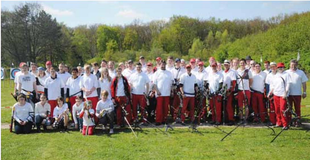
Sieger und Platzierte des Qualifikationsturniers der Bogensportabteilung des Hammer Sportclubs 08 auf der Bogensportanlage am Unteren Heideweg.