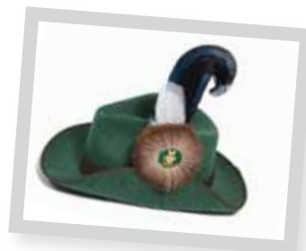
Schützenhüte ab 39,90 €