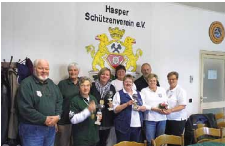
Mannschaftsführer und Gewinner der Hasper Vereine.

Am 30.5.2013 war es wieder so weit. Bereits zum dritten Mal hintereinander gelingt dem Gastgeber Hasper Schützenverein von 1866