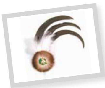
Schützenfedern ab 8,90 €

Ob Schützenkleidung oder Uniformzubehör, Säbel oder Königskette, Fahnen oder Orden: Als Deutschlands größter Versandhandel für Schützenbedarf finden Sie bei uns alles, was das Schützenfest so schön macht.