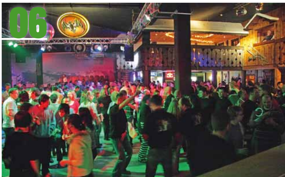
Damen-Programm zum 64. Westfälischen Schützentag in Gladbeck und Gelsenkirchen: Mit einer Après-Ski-Party im Alpincenter Bottrop haben sich die Verantwortlichen ein ganz besonderes Highlight einfallen lassen.