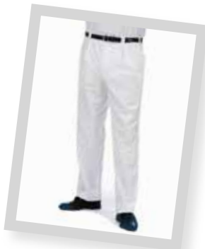
Schützenhosen ab 25,90 €