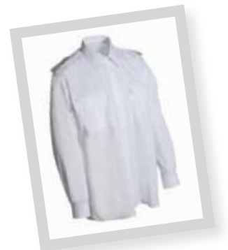
Schützenhemden ab 21,90 €