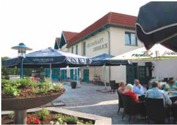
Angekommen im Hotel wurde erst einmal die Kaffeetafel eröffnet.