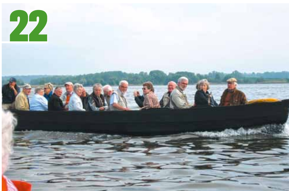
Pfingstfahrt 2013: Die ehrenamtlichen Mitarbeiter und Ehemaligen reisten in das Land der „Tausend Seen“ nach Mecklenburg-Vorpommern.