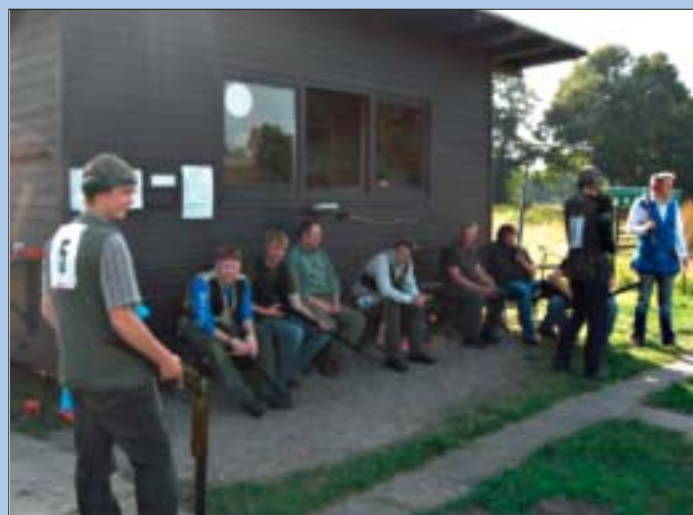
Warten auf die nächste Runde ...