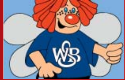
Deutsche Meisterschaften in München