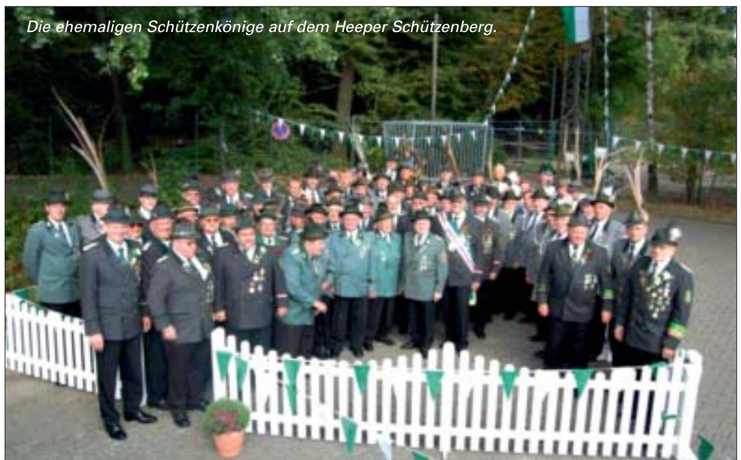
Die ehemaligen Schützenkönige auf dem Heeper Schützenberg.