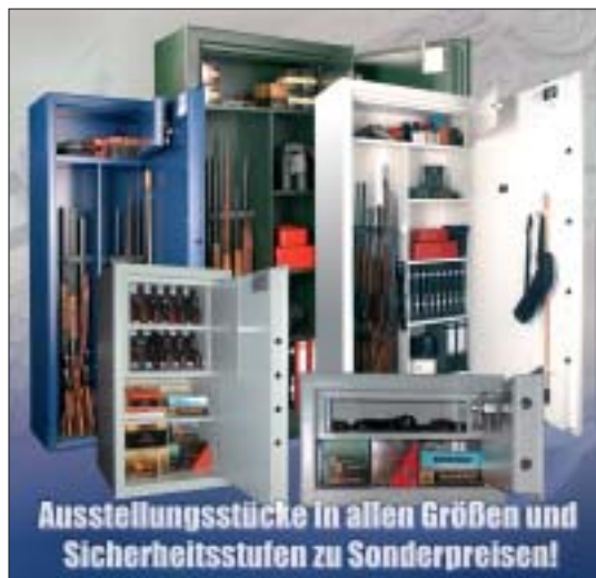
Ausstellungsstücke in allen Größen und Sicherheitsstufen zu Sonderpreisen!

Infos: Gehmann GmbH & CO KG, Postfach 11 05 48, 76055 Karlsruhe, Telefon: 0721-24545/6, Telefax: 0721-29888, E-mail: info@gehmann.de, Internet: www.gehmann.com Lieferung nur über den Fachhandel!