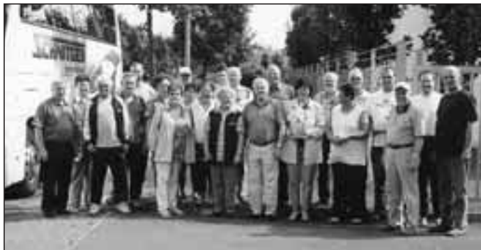
Die lippische Reise-Delegation bei ihrer Abfahrt in Detmold.

Der Schießwettbewerb zeigte wieder einmal, dass Kaunas ein enormes Potential an Sportschützen besitzt, doch die Lipper konnten einigermaßen mithalten und gewannen die Mannschaftswertung