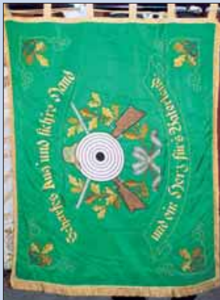
Der SSV Müsse 1925 e.V. stellte seine alte Fahne aus dem Jahre 1926 zum Fototermin vor.