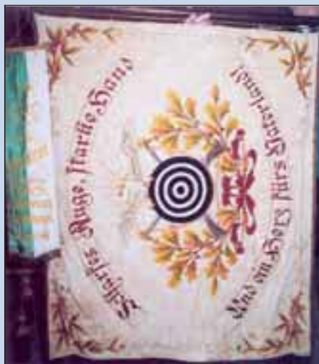
Die Hellerthaler Schützengesellschaft e.V. wurde bereits im Jahre 1840 gegründet. Die Fahne stammt aus dem Jahre 1900 und ist somit bereits über 100 Jahre alt. Die alte Königskette stand leider beim Fototermin nicht zur Verfügung. Man hatte allerdings einen handgeschnitzten Königsvogel aus dem Jahre 1952 mitgebracht.