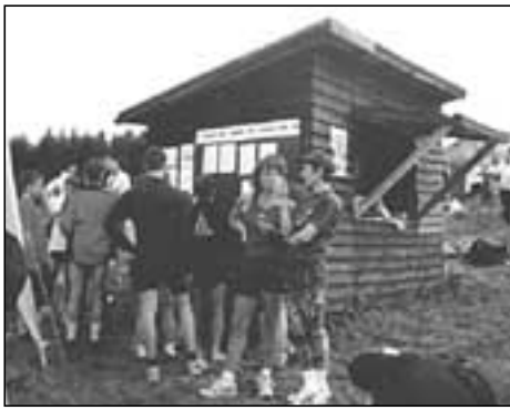
Fachsimpeln am Info-Stand

Unser Dank gilt allen vor und hinter den Kulissen dieser Veranstaltung.