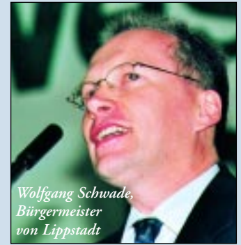
Wolfgang Schwade, Bürgermeister von Lippstadt