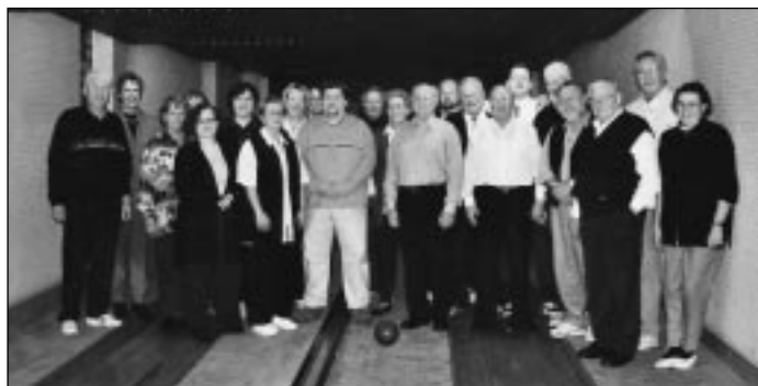
Die Arbeit im Jahr 2000 beendeten die Vorstands-Mitglieder des Schützenkreises Ennepe-Ruhr mit einem gemütlichen Beisammensein. Das Kegeln Damen gegen Herren brachte allen viel Spaß. Helmut Orth