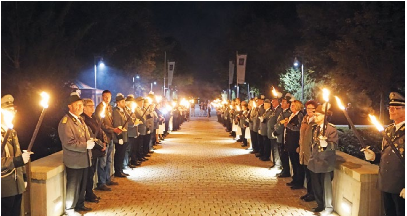
Aufstellung der Fackelträger zum Westfälischen Schützentag