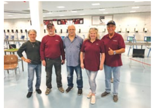
Aufsteiger der Relegation ist unter anderem der BSV Wattenscheid-Höntrup

In der Relegation zur Verbandsliga konnten sich die Vereine SpSch St. Hub. Brilon 1, Pol SV Dortmund 1, SpSch Raesfeld 1, SV St. Hub. SBS Kaunitz 1, BSV Wattenscheid-Höntrup 1, SSG Teutoburger Wald 1