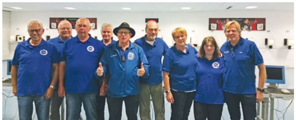
Auch der PolSV Dortmund durfte den Aufstieg feiern