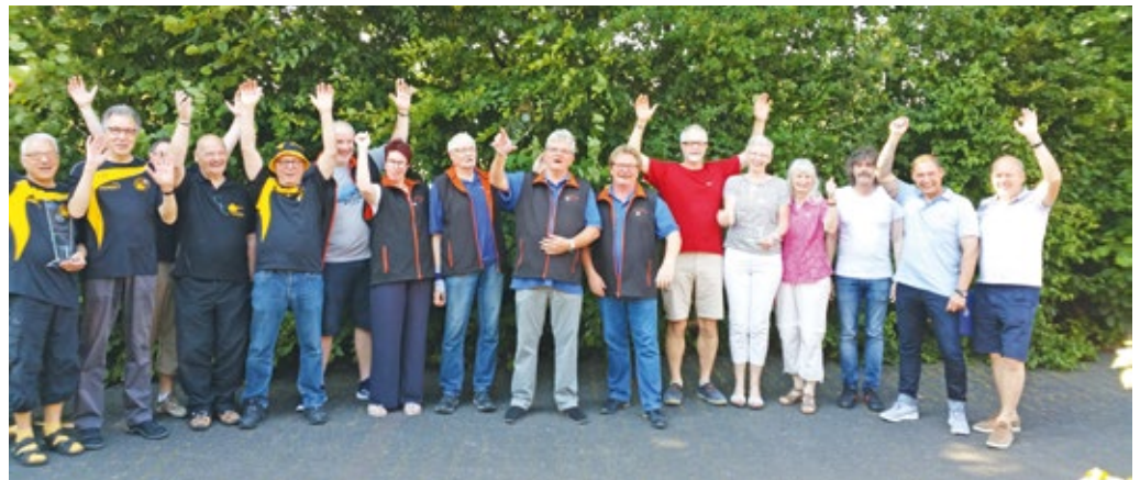
Sieger der Westfalenliga wurden die Bodelschwingher vor Wanne-Eickel und Lipperbruch