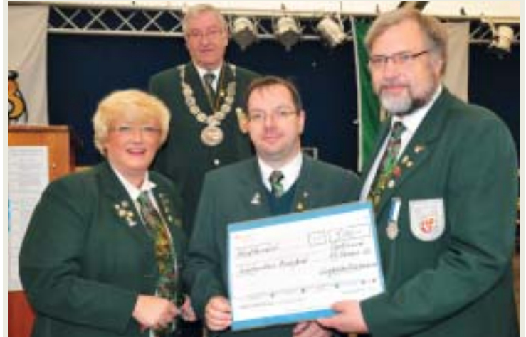
Schützenkreis 3100 - Bielefeld als aktivster Kreis