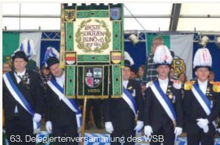
63. Delegiertenversammlung des WSB