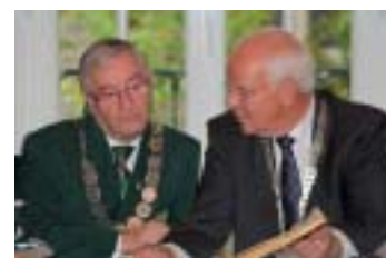
▲ Eintrag in das goldene Buch der Stadt Stadtlohn