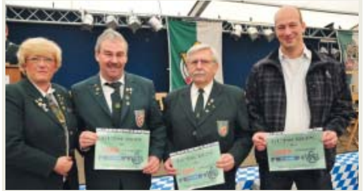
Drei ausgeloste Vereine mit Munitionspräsenten