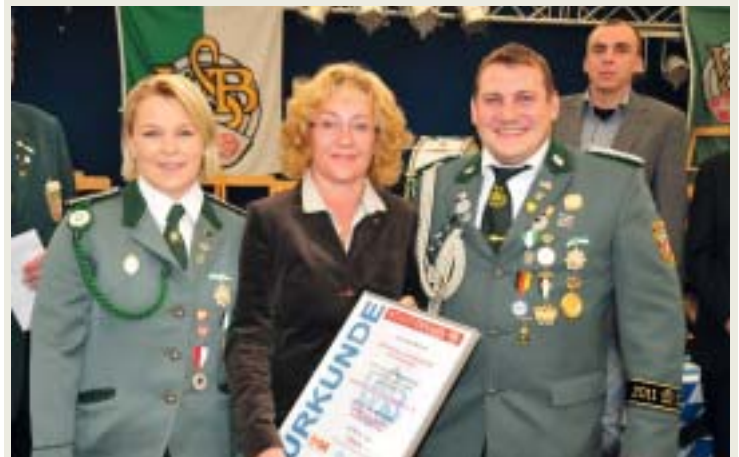
„Schützenhilfe“ Platz 2