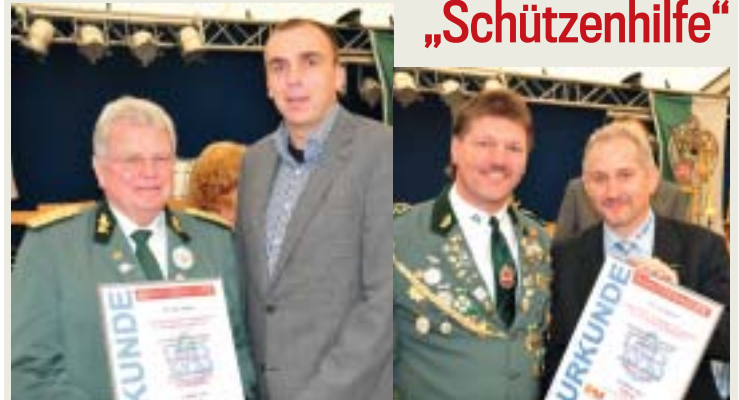
„Schützenhilfe“ Platz 1