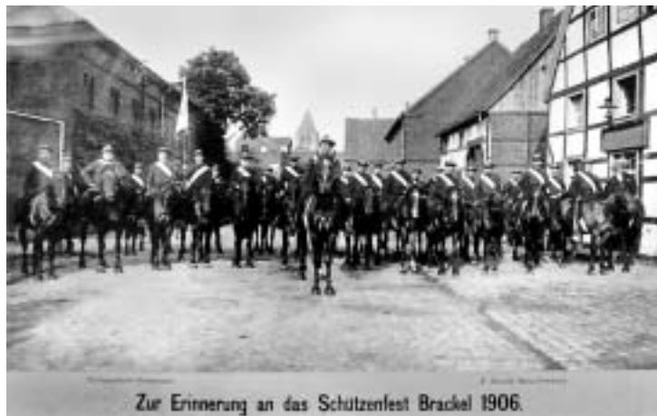
Zur Erinnerung an das Schützenfest Brackel 1906.

Wenn man die Namensliste der Königspaare durchgeht, stößt man immer wieder auf Namen von alten Bauerngeschlechtern, deren Nachkommen noch heute in der heimat-