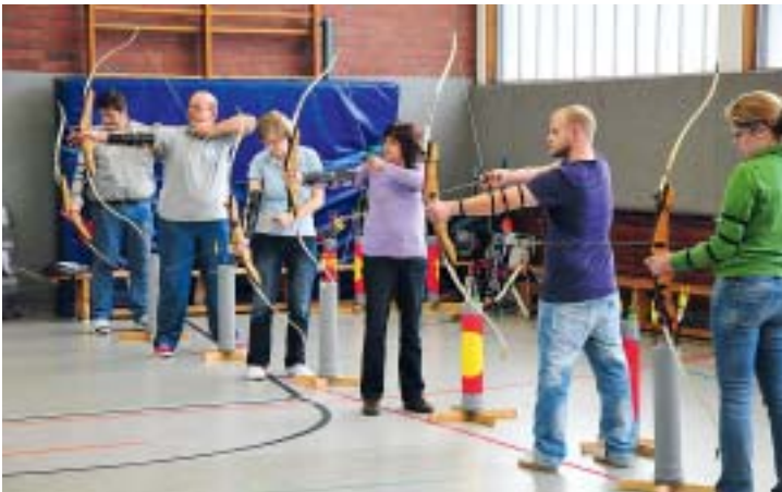
▲ Mit großem Erfolg beteiligte sich die Bogensportabteilung des HSC 08 an der Aktion Ziel im Visier des Deutschen Schützenbundes.