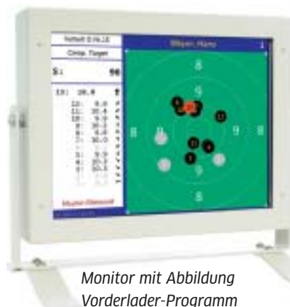
Monitor mit Abbildung Vorderlader-Programm

und ein Industrie-PC mit kalte- und hitzeresistenten Bauteilen in einem gegen Spritzwasser und Pulverstaub geschützten Gehäuse verbaut. Die vergrößerten Monitore mit einer höheren Bildauflösung lassen auch die Zuschauer einfacher am Wettkampfgeschehen teilnehmen, ohne dass es zusätzlicher Zuschauermonitore bedarf.