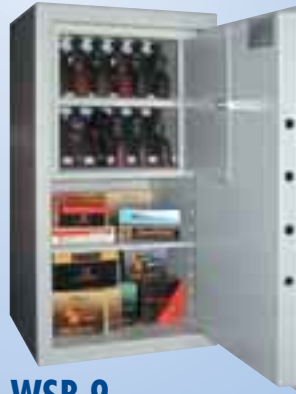
WSB 9 Sicherheitsstufe B mit Innentresor