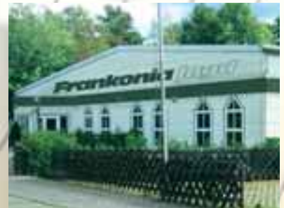
Frankonia Jagd-Filiale Bexbach, Am Butterhügel 6