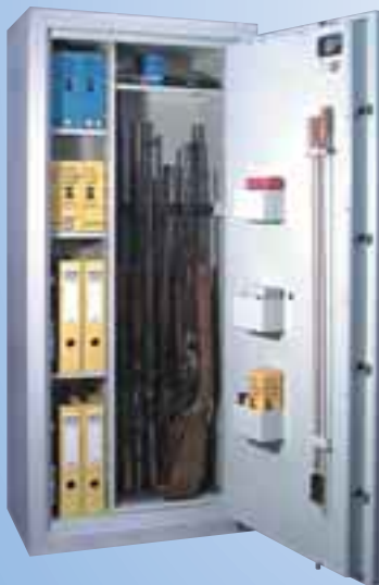
WSB 7 Euro VdS Klasse N(0) mit Regalteil