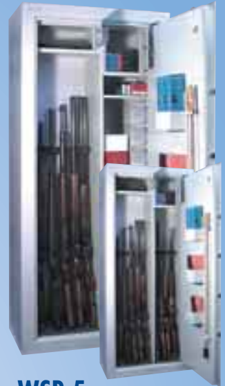
WSB 5 Sicherheitsstufe B 2 Innentresore und Regalteil

Schränke des Widerstandsgrades N (0) mit VDS Prüfplakette, Tür und Korpus vierwandig - Feuerschutzisolierung Versicherungseinstufung privat bis 50.000* EUR *unverbindliche Richtlinien Stand 09/01