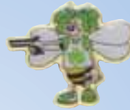
Bienchen „Pistole Mädchen“