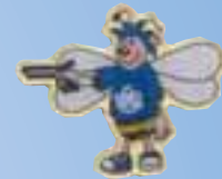
Bienchen „Pistole Junge“