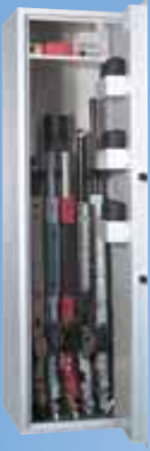
WSB 1 Sicherheitsstufe A mit Innentresor

Sicherheitsstufe B nach VDMA 24992m Tür und Korpus doppelwandig - Feuerschutzisolierung Versicherungseinstufung privat bis 37.500* EUR (nur bis 31. 12. 2003) *unverbindliche Richtlinien Stand 09/01