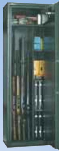
WSB 4 Sicherheitsstufe B Möbeleinsatztresor Innentresor+Regalteil