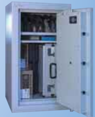
WSB 10 Euro VdS Klasse N (0) m. 6 Waffenhalter