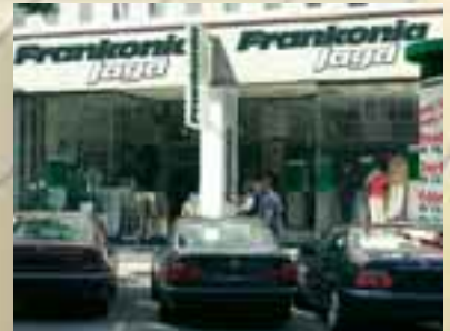
Frankonia Jagd-Filiale Dortmund, Hansastraße 7-11