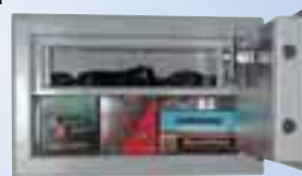
WSB 8 Sicherheitsstufe B mit Innentresor