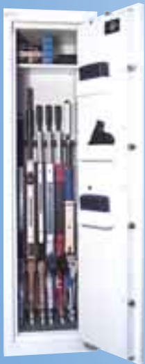
WSB 6 Euro VdS Klasse N(0)

Schränke des Widerstandsgrades N (0) mit VDS Prüfplakette, Tür und Korpus vierwandig - Feuerschutzisolierung Versicherungseinstufung privat bis 50.000* EUR *unverbindliche Richtlinien Stand 09/01