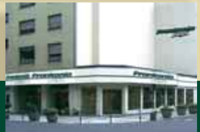
Frankonia Jagd-Filiale Köln, Krebsgasse 5

WEITERE INFORMATIONEN UNTER www.Frankonia.de