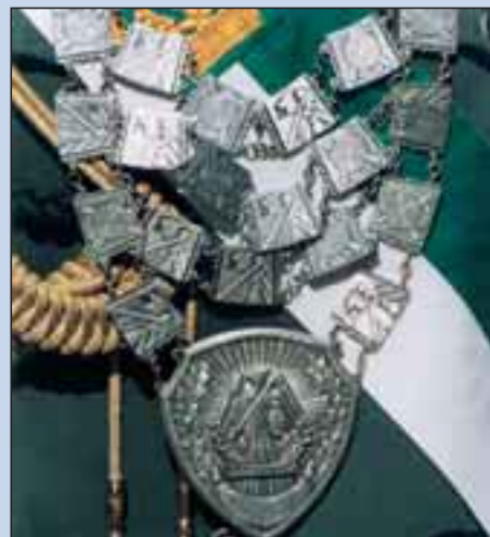
1921 wurde der Schützenverein Arrenkamp e.V. gegründet. Die Fahne trägt das Fertigungsjahr von 1956. Die Königskette wurde 1951 aus Silber gefertigt. Sie wird von Königin Ulrike Tönsing beim Fototermin getragen.