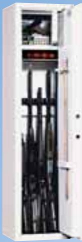
WSB 2 Sicherheitsstufe A mit extra großem B Innentresor