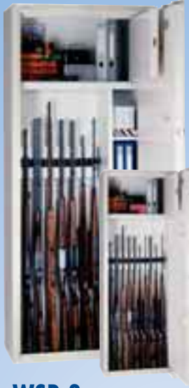
WSB 3 Sicherheitsstufe A mit extra großem B Innen- tresor+Regalteil