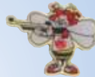
Bienchen „Gewehr Mädchen“