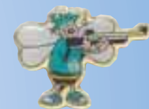
Bienchen „Gewehr Junge“