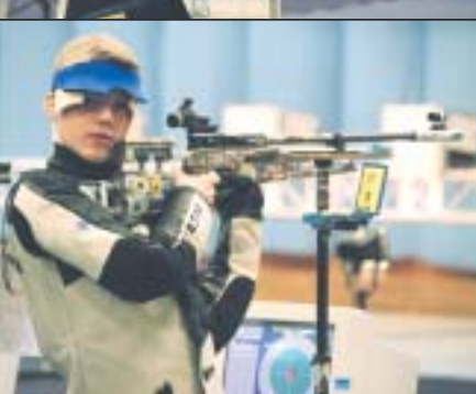
Deutscher Meister: BSV Buer-Bülse e.V.