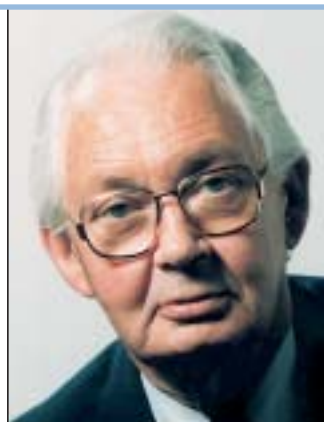
Dr. Gerhard Langemeyer, Oberbürgermeister der Stadt Dortmund

Zum 19. Mal findet der „internationale Saisonauftakt der Sportschützen“ im Landesleistungszentrum Dortmund statt. Ich weiß, dass die Verantwortlichen des Westfälischen Schützenverbandes auch in diesem Jahr dieses international renommierte Sportereignis wieder einmal vorbildlich auf die Beine stellen werden!