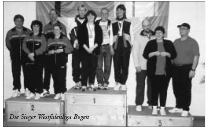
Die Sieger Westfalenliga Bogen