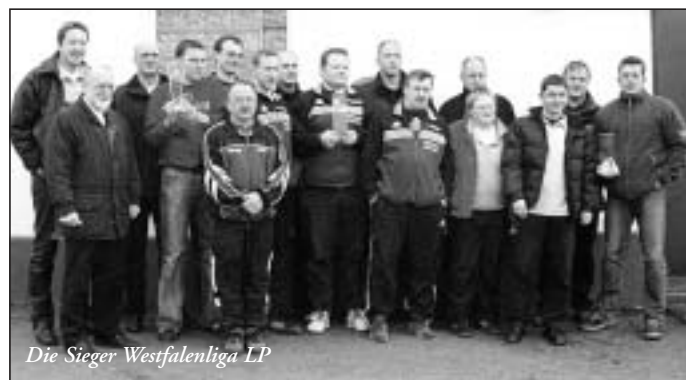
Die Sieger Westfalenliga LP